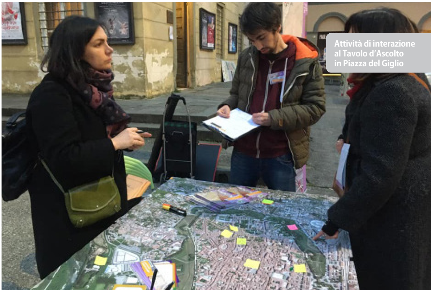
Attività di interazione al Tavolo d'Ascolto in Piazza del Giglio