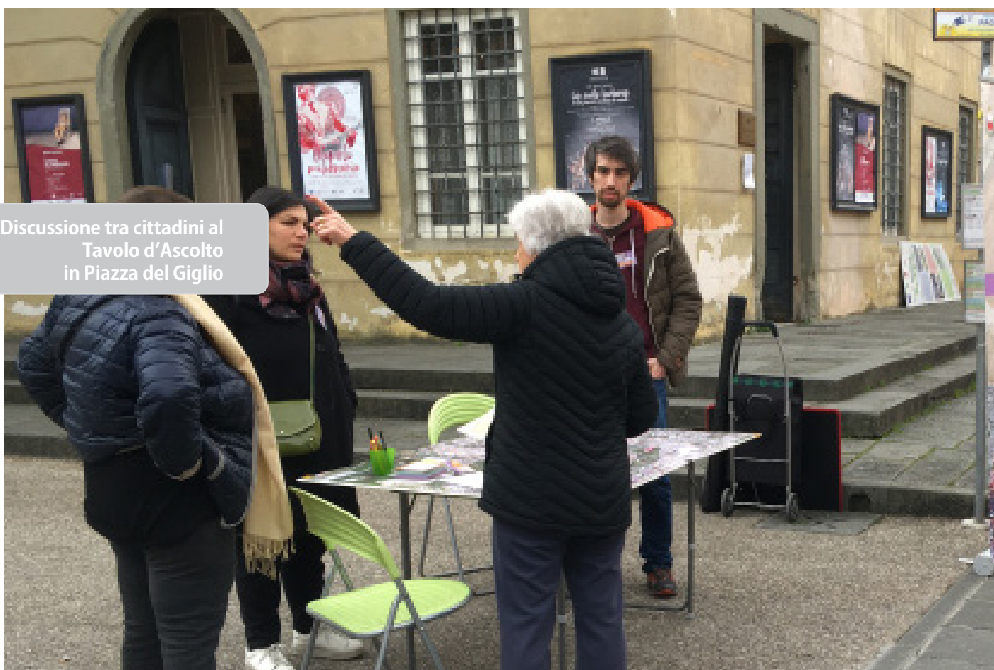
Discussione tra cittadini al Tavolo d'Ascolto in Piazza del Giglio

Io sono Lucca: facciamo un piano_Report Punto d'ascolto itinerante_Febbraio 2020